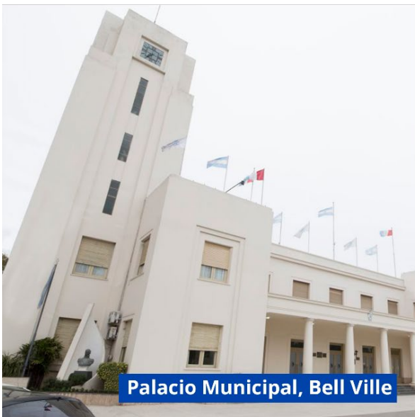
Palacio Municipal, Bell Ville