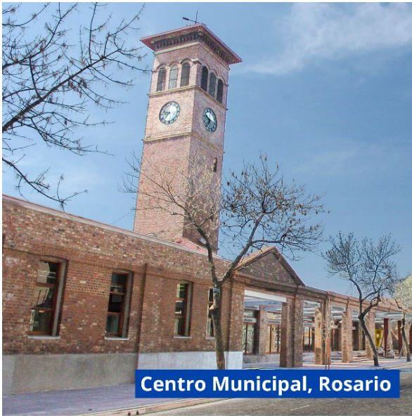
Centro Municipal, Rosario