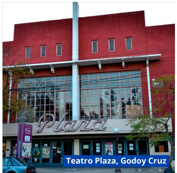
Teatro Plaza, Godoy Cruz

Edificios municipales con legajo de obra en elaboración para ejecutar en el año 2024